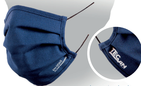
Impression des deux côtés du masque

Masque fabriqué en tissu ignifuge TecVin.